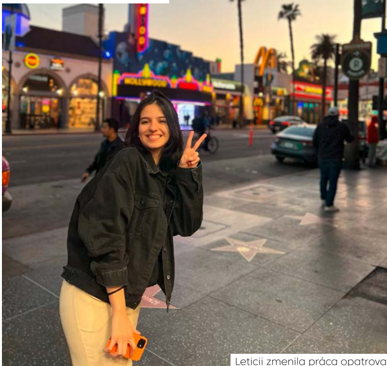
Leticii zmenila práca opatrovateľky v slovenskej rodine život o 180 stupňov.